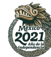
RELACIÓN DE CONTRATOS